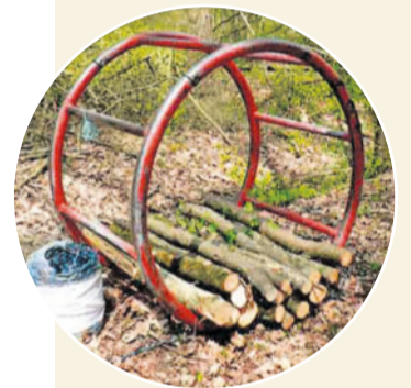
Holz war immer schon ein wertvoller Rohstoff.

Im ersten Drittel des 19. Jahrhunderts stellt das Holz einer der wenigen Reichtümer des Wallis dar. Darüber weiss man um die Schutzfunktion der Wälder und darum versucht die Regierung, sie zu schützen. Von 1827 an unternimmt der Kanton Anstrengungen, welche die Holzschläge auf lokale Bedürfnisse reduzieren. Auch diese werden strikte begrenzt. Unter Androhung von Bussen muss jeder Eingriff in den Wald bewilligt werden.