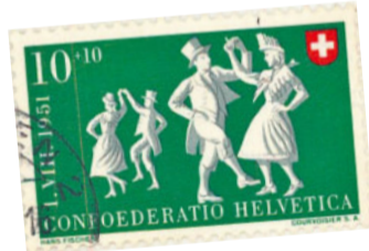
Sogar die Briefmarke wird von der Folklore erobert.

Werken. Also sucht man in den Tiefen aller Schubladen nach alten Kleidern, in den Scheunen und Ställen nach altem Werkzeug. Dazu wird gesungen, getanzt, oft ohne Noten und in Nachahmung der Vorahren. Man nimmt auch die Anregungen von Söldnern auf, die eben erst aus fremden Diensten zurückgekehrt sind und die von grossen Festen um die Lagerfeuer berichten. So kommt es, dass der Grenadier in den folkloristischen und kirchlichen Umzügen und Prozessionen seinen hohen Stellenwert erhält. Im Laufe der Jahrzehnte kennt die Gruppe des Vieux Champéry viele grosse Erfolge. Sie vertritt das Wallis in der Deutschschweiz, aber auch in ganz Europa. Das Wallis feiert seine Vergangenheit, der es eben erst entrinnt.