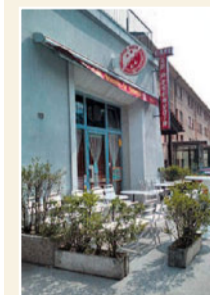
Das frühere Reservoir der Wasserversorgung von Sitten dient jetzt als Café-Restaurant.

Die Unternehmung Dumont richtet sich an der Einmündung der Borgne in den Rotten ein. Dort wird das Wasser gefasst und gefiltert und über eine Leitung über den Wasserlauf in die Stadt geleitet. Das Wasser wird in einem Reservoir im Norden der Stadt gespeichert. Dort befindet sich übrigens heute ein Restaurant. Gleichzeitig wird Elektrizität produziert, die der Strassenbeleuchtung dient. Durch diese Konkurrenz droht der ohnehin schon in argen Schwierigkeiten steckenden Gasfabrik der Ruin. Die Stadt entscheidet sich schliesslich, die Gasfabrik weiter zu betreiben. Sie dient als zusätzliche Energiequelle. Zwei Jahre später eröffnet die Stadt öffentliche Bäder an der Avenue du Midi. Bis zum Ersten Weltkrieg soll die Bevölkerung «vom Frühling bis in den Herbst» und von «Sonnenaufgang bis Sonnenuntergang» in den Genuss der Wohltaten eines gepflegten öffentlichen Bades kommen.